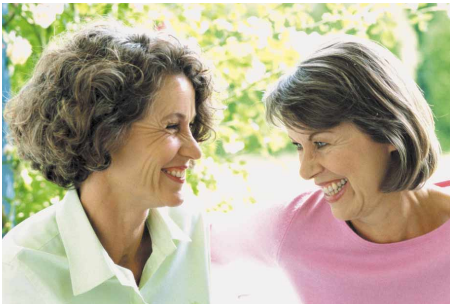
Lebenslanges Lernen wird immer mehr zur Notwendigkeit aller Generationen

„Mensch im Arbeitsleben“ 7. Juni 2006 Wirtschaftskammer Steiermark Unternehmensservice/Wirtschaftsservice, Körblergasse 111–113, 8020 Graz. Informationen: 0316/ 601-797 roswitha.froehlich@wkstmk.at