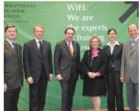
WIFI fördert Managementausbildung und Wissenstransfer in Kroatien. Im Bild: Vertreter des WIFI und der kroatischen Projektpartner bei der Eröffnung

Der WIFI Internationaler Know-how-Transfer (IKT) setzt seine Expansionsstrategie fort. Im Jänner 2006 wurde die Niederlassung in Zagreb eröffnet: WIFI Austria Croatia. Erste Schwerpunkte sind Firmen-Intern-Training (FIT), Trainerausbildung vor Ort und Support für österreichische Unternehmen in Kroatien. Das