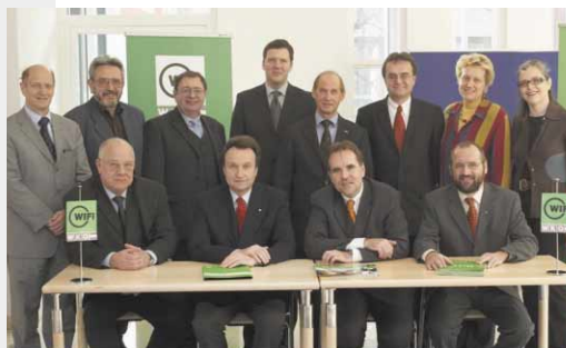
Lobbying für berufliche Weiterbildung – das ist das Ziel des WIFI-Kuratoriums

Ziel des Kuratoriums ist es, eine langfristige WIFI-Strategie zu entwickeln und die WIFI als die Bildungsinstitute der Wirtschaft zu positionieren. „Mit Hilfe der Kuratoriumsmitglieder können wir nun österreichweit das Lobbying für den Standortfaktor Bildung verstärken“, betont WIFI-Kurator Dr. Walter bei seiner Antrittsrede.