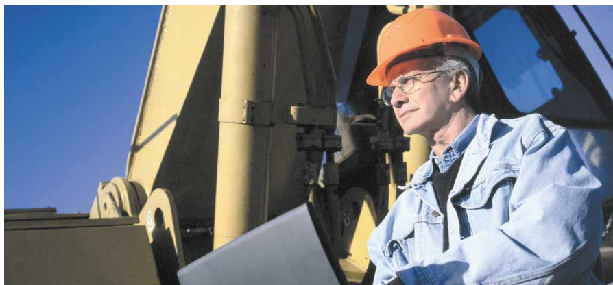
Gelehtes Generationenmanagement bei der VOEST – wo Lehrlinge und ältere Mitarbeiter voneinander lernen

Unter dem Motto „50+“ hat die Adeg-Gruppe ein Pilotmodell in der Salzburger Filiale Bergheim gestartet. „50+ Märkte“ haben ihr Angebot auf die Konsumbedürfnisse älterer Menschen abgestimmt, bewusst werden ältere ArbeitnehmerInnen eingesetzt. Erstes Fazit: die Kundenzufriedenheit ist gestiegen, Die Mitarbeiterfluktuation ist gesunken.