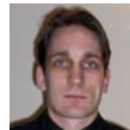
Jürgen Binder Meßtechnik GmbH & Co KG

Wir arbeiten schon seit Jahren eng mit dem WIFI Niederösterreich zusammen, teilweise auch im FIT – Firmen-Intern-Training. 2006 wurden Grundschulungen im Bereich Verkauf für unsere südosteuropäischen Mitarbeiter/innen durchgeführt: Basiskurse für Verkauf und Einrichtungsberatung. Das Feedback der Schulungsteilnehmer/innen war durchwegs gut. 2007 werden wir die gut funktionierende Kooperation mit dem WIFI Niederösterreich fortsetzen. Die betriebliche Weiterbildung wird sich in Zukunft in Richtung praxisnahes Lernen entwickeln: direkt am Arbeitsplatz und im Job, wo man das Gelernte direkt umsetzen kann.