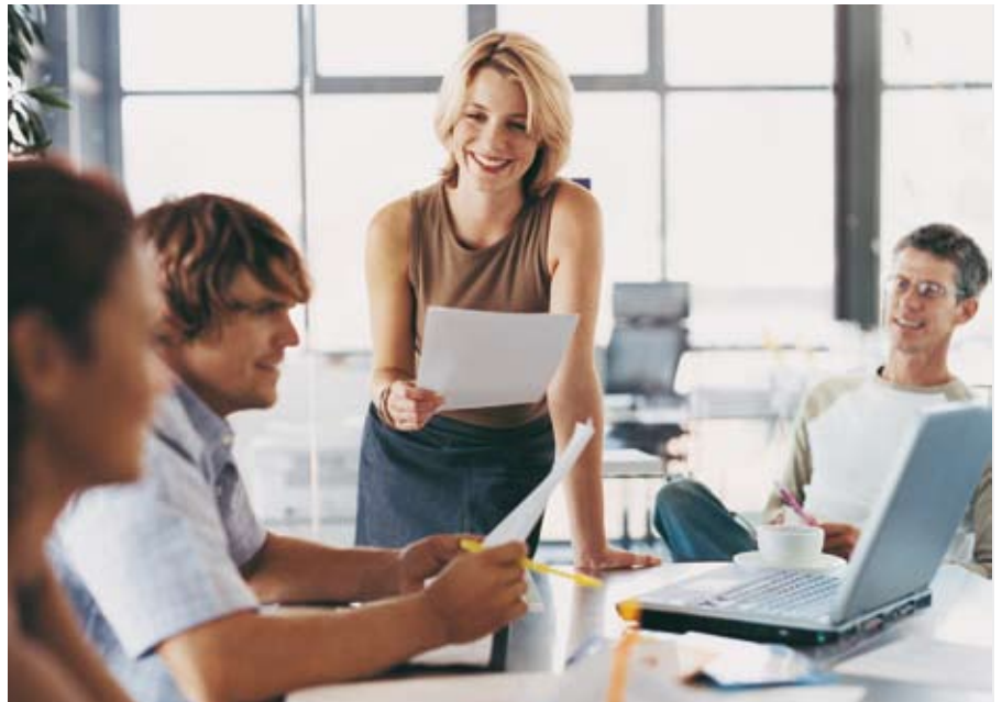
Für betriebliche Weiterbildung gibt es attraktive Förderungen. Informationen gibt es in jedem Landes-WIFI.