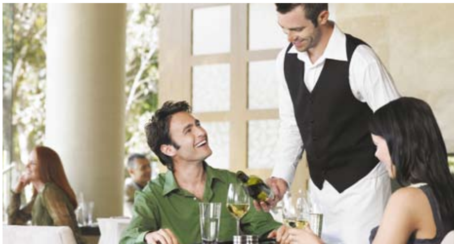
Großzügige Förderungen gibt es u. a. für die Höherqualifizierung neuer Tourismus-Mitarbeiter/innen.

Die konkreten Fördermöglichkeiten sind in jedem Land unterschiedlich. Nationale Fördertöpfe und Programme zur Arbeitsmarktförderung können ebenso angezapft werden wie internationale Mittel aus EU-finanzierten Programmen wie zum Beispiel dem Europäischen Sozialfonds.