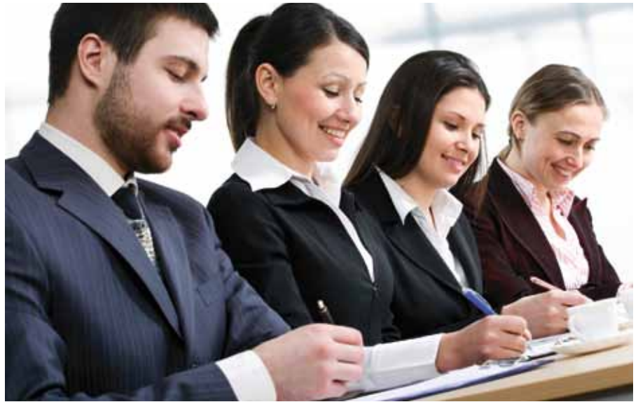
Mit den erworbenen persönlichen Kompetenzen steigen Selbstsicherheit und Qualifikation.

Zum Start der Initiative wurde ein kostenloser Online-Test auf www.it-initiative.at vorgestellt: Mit Fragen aus dem Computer-Grundlagenwissen kann jede/r den eigenen Wissensstand prüfen. Dazu gibt es passende, teils kostenlose Weiterbildungsangebote. 2010 will die Initiative mehr als 100.000 Personen erreichen, wobei der Schwerpunkt auf Schulen, (Wieder-)Einsteigerinnen und (Wieder-)Einsteigern, Älteren sowie Migrantinnen und Migranten liegt. Unter allen Teilnehmenden werden WIFI-Bildungsgutscheine verlost.