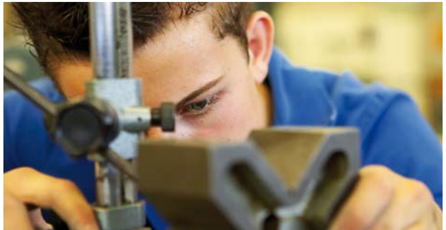
Inhaltliche Tiefe und direkte Verwertbarkeit: Das schätzen die Teilnehmer/innen an Veranstaltungen im WIFI.

Im Bereich „Technik“ ist der Marktanteil mit 36 Prozent ebenfalls außerordentlich hoch, es wurde ein Umsatz von 13,8 Millionen Euro erzielt (Branchenumsatz: 38,3 Millionen Euro). Nicht zuletzt ist das hervorragende Ergebnis auf die gute Ausstattung der WIFI Einrichtungen zurückzuführen.