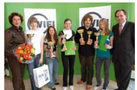
WKÖ-Vizepräsidentin KR Römer (links) und WIFI Kurator Dr. Walter (rechts) mit den strahlenden Siegerinnen und Siegern der WIFI Sprachmania 2007.

www.wifi.at Mit einem Klick zu allen News.