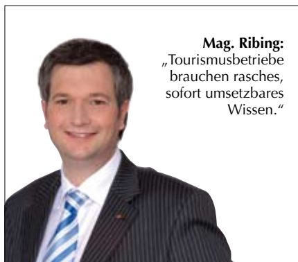
Mag. Ribing: „Tourismusbetriebe brauchen rasches, sofort umsetzbares Wissen.“

Das Tourismusland Österreich muss neue Zielgruppen erschließen. Das nötige Know-how dafür vermittelt eine neue, kompakte Aktivität unter dem Namen ExportKompetenzWerkstatt Tourismus von WIFI Österreich, Außenwirtschaft Österreich (AWO) und Bundessparte Tourismus und Freizeitwirtschaft: Dabei wird Tourismusbetrieben Basiswissen für die Akquisition ausländischer Gäste in 24 Stunden vermittelt. Themen und Inhalte des Kurses wurden vom WIFI Österreich entwickelt, ebenso die begleitenden Skripten.