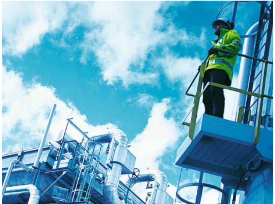
Größter Arbeitgeber bei Green Jobs ist der Bereich erneuerbare Energie – im Bild eine Biomasseanlage.

Entsprechend der WIFI-Forderung nach durchlässigen Bildungswegen können auch Personen ohne Hochschulabschluss teilnehmen: Voraussetzung ist die Universitätsreife oder eine abgeschlossene Berufsausbildung sowie mehrjährige einschlägige Praxis. Der Lehrgang kann sowohl an der Uni Klagenfurt als auch an WIFI-Standorten in ganz Österreich besucht werden. Absolventinnen und Absolventen erhalten den akademischen Grad Master of Advanced Studies (MAS).