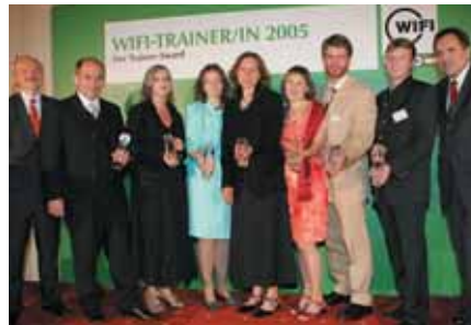
Großen Applaus gab es für die besten TrainerInnen des Jahres 2005

Die Besten von mehr als 11.000 WIFI-TrainerInnen wurden erstmals mit den Trainer-Awards ausgezeichnet. Eine unabhängige Expertenjury kürte aus 70 – allesamt hoch qualifizierten – Einreichungen die Sieger in den sieben WIFI-Geschäftsfeldern.