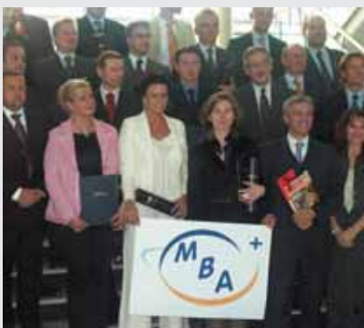
Strahlende Gesichter und viel Freude bei den Absolventen des ersten WIFI-MBAs

Die berufsbegleitenden Unterrichtsmodule werden, teilweise in englischer Sprache, im Block abwechselnd an der Uni Klagenfurt und in Landes-WIFIs abgehalten – Höhepunkt bildet eine Auslandswoche in London an der renommierten University of Westminster mit Exkursionen zu internationalen Konzernen. Inhaltliche Schwerpunkte sind strategische Unternehmensführung, Marketing, internationales Recht, Human Resource und Change Management.