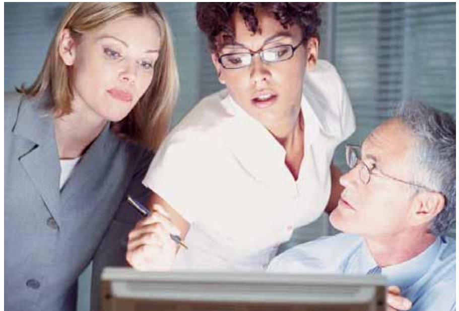
Die Kombination von Online-Learning und Präsenz im Kurs bringt die besten Ergebnisse.

→ rungen aus, wie man es von Communities kennt.“ Bugl betont dabei die Notwendigkeit des Blended Learnings: „Es gibt Situationen, die den Einzelnen zu Hause ablenken, daher ist es auch ab und zu notwendig, an Prüfungstermine zu erinnern und in der Gruppe miteinander zu diskutieren. Die Präsenzphasen sind ein wesentlicher Bestandteil des eLearnings.“