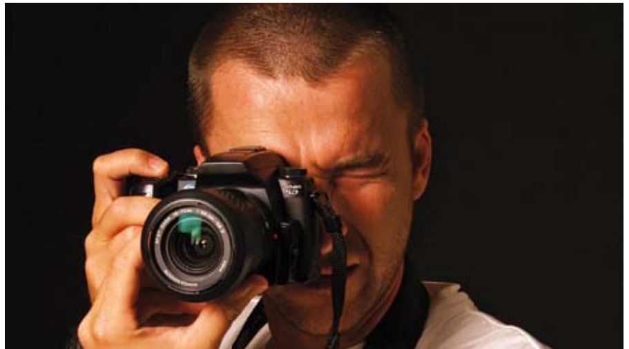
Im Fokus: Innovative Weiterbildung für eine erfolgreiche Zukunft