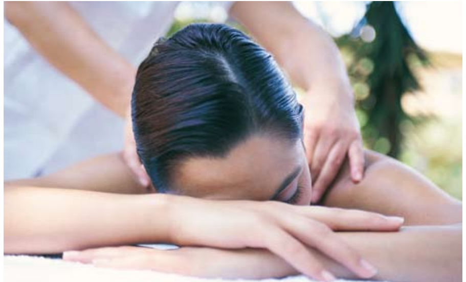
Die Mitarbeiter/innen dreier Mühlviertler Wellnesshotels besuchen ihre WIFI-Weiterbildung direkt am Arbeitsplatz, der weite Weg nach Linz entfällt.