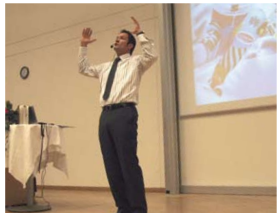
Armin Assinger beim zweitägigen Managementkongress „Upgrade Your Perspective“ in Klagenfurt

algischer Stellen wie „Mausefalle“ (Sprung ins Ungewisse), Steilhang (perfekte Technik) und „Lärchenschuß“ (durchatmen) machte er sehr anschaulich klar, welche Führungsqualitäten vonnöten sind, um schließlich eine Topleistung ins Ziel zu bringen.